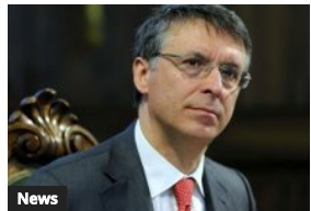
News Anac, slitta a metà aprile il via all’albo dei Commissari di gara