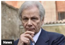
News Sorgente Sgr commissariata da Bankitalia