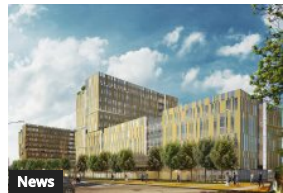
News Covivio in Italia punta su uffici, hotel e sviluppo

Articoli correlati Altri dello stesso autore